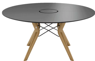
table de conférence, hauteur totale de 76cm