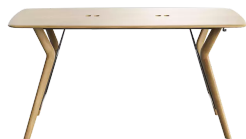
table de réunion, hauteur totale de 110cm