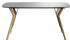
table de réunion, hauteur totale de 110cm