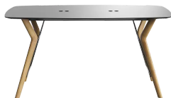
table de réunion, hauteur totale de 110cm